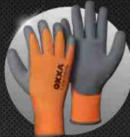
X-GRIP-THERMO 51-850 Art. nr. 1.51.850.00