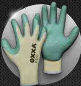
X-GRIP 51-000 Art. nr. 1.51.000.00